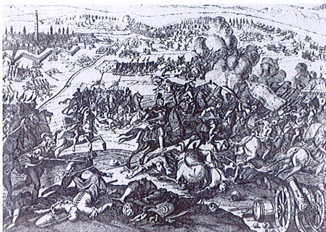
37. Bitwa pod Wiedniem, rys. i ryt. N.-R. Cochin, akwaforta, po 1683, kat. poz. 42

Pytanie nr 15: Czy posiadają Państwo zdigitalizowaną w wysokiej rozdzielczości rycinę opisaną poniżej, i jeśli tak czy możemy prosić o udostępnienie dobrej jakości pliku na potrzeby opracowania konkursowego. Wg podpisu rycina jest ze zbiorów MWP. Opis: Bitwa pod Wiedniem, akwaforta, po 1683. MWPol., nr ew. 9621. Załączam jej skan z publikacji "Hanna Widacka, Jan III Sobieski w grafice XVII i XVIII wieku".